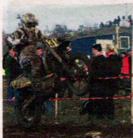
Gotland Grand National.