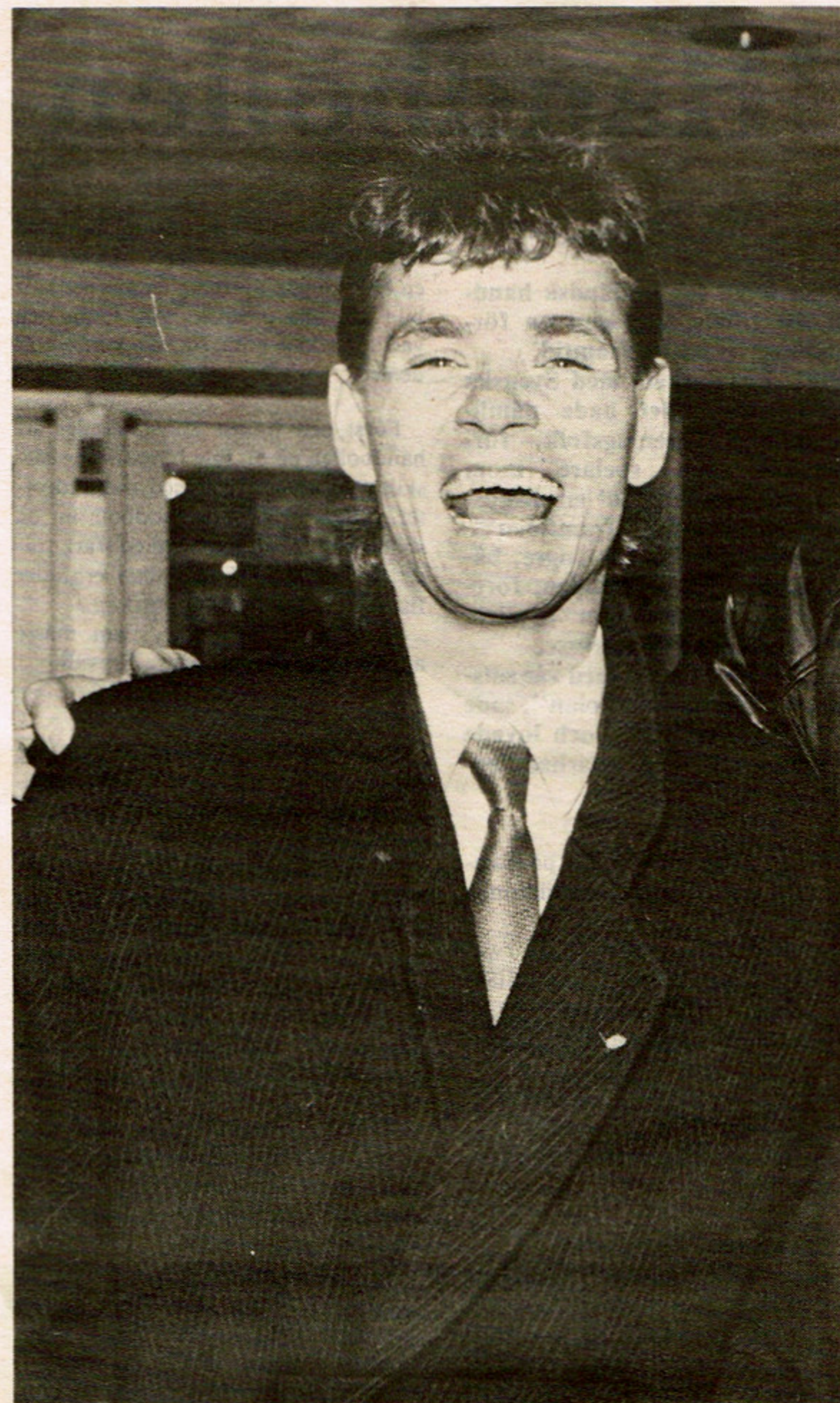
□ Håkan Loob har inte mycket kvar nu i Calgary innan han flyttar hem till Sverige, men först dock Stanley Cup och Wayne Gretzky närmast.