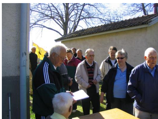
VIF och Gutepojkar/-töisar 8.5.2011