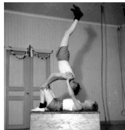
Duktiga gymnaster från Mästerby Golf