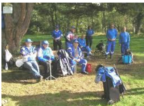
Wisby Bollklubb tar en paus.

Ett av favoritställen var Gärdesvät'n som ligger halvväges ner mot Petes. Här samlades entusiasterna på kvällstid. På dagarna var det arbete så det fick bli efter mörkrets inbrott. Någon belysning av modernare slag var det så klart inte frågan om. Man var inte rädlösa. Så kallade hynslyktor (primuslyktor) fick lysa upp och utgöra må och så spelades med enespåkar och ansjovisburkar så man kunde höra var "bollen" fanns.