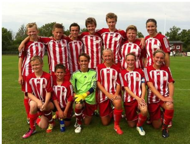
Fårösunds GOIK P/F Div 2