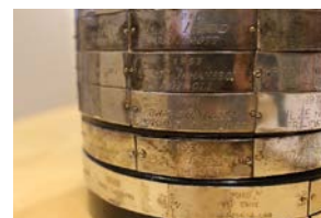
Lars H. Lindqvist Vandringspris (VIF Gute)