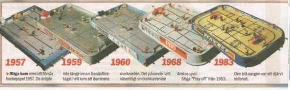
1957 Stiga kom med sitt första hockeyspel 1957. De dröjde inte länge innan Transkvarianten taget hell kom att dominera marknaden. Det påminde i allt väsentligt om konkurrenten Aristos spel. Stiga "Play off" från 1983. Den blå sargen var ett djurt stiltbott.

Kristianstads sportdykarklubb försöker komma in i Guinness rekordbok genom att spela 50 timmar under vatten. Året är 1998.