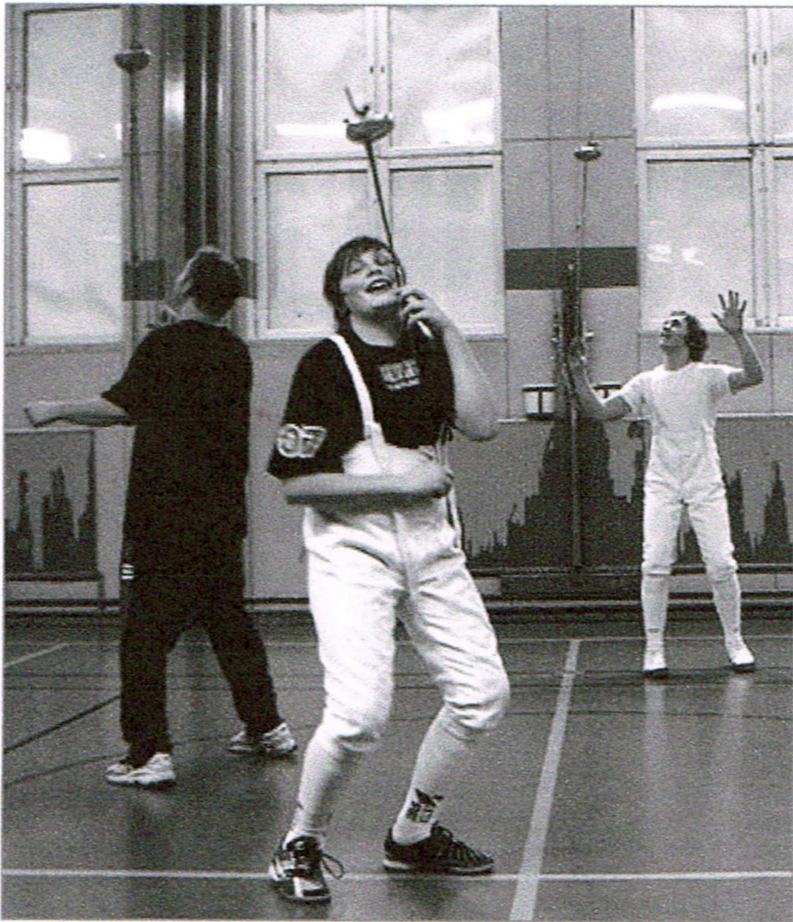
Balans och kroppskontroll är viktigt