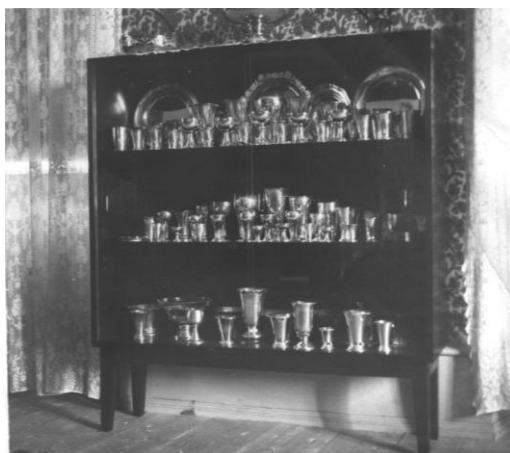
Oscar Blombergs prisskåp.

Från Frankfurt am Main kom inbjudning om deltagande uti en allmän ”Turnfest”, hvilken klubben af flere skäl besvarade afböjande.