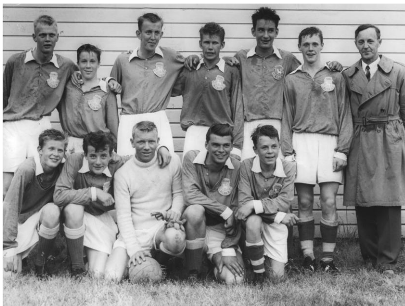
DM-Mästarna 1957 VAIK Juniorlag